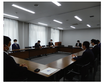
奈良市長への表敬訪問

45歳以下の若手経営者や後継者、幹部候補など、バイタリティあふれる会員で組織され、さまざまな活動を通して交流を図っています。また会員相互の連携により企業経営者として研鑽を積みながら、地域への貢献活動や行政への政策提言も行っています。