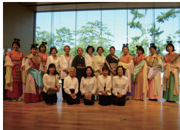
関西商工会議所女性会連合会総会奈良大会

女性の経営者や役員などで組織され、女性ならではの目線で社業・地域社会などの発展のため、さまざまな活動を行い、交流を図っています。