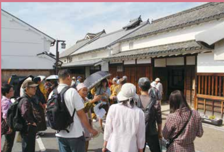
今井町 町並み散歩

今年50周年を迎えた全国町並み保存連盟のパイオニアである、重要伝統的建築物群保存地区の橿原市今井町でこの町の保存にかける人たちの歴史への思いや、おもてなしの心を「Nara観光コンシェルジュ」の案内で体験していただきます。