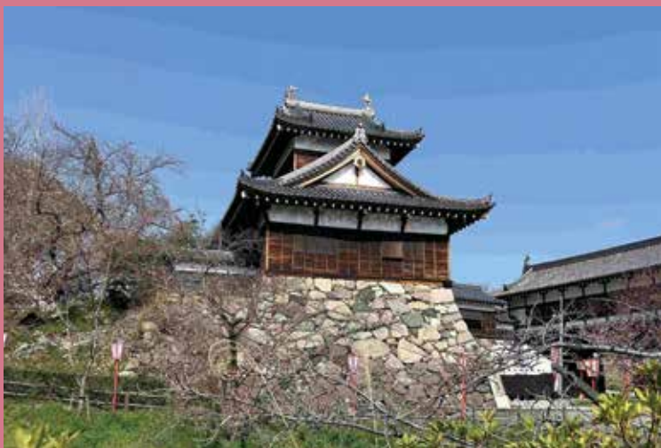
郡山城追手門と向櫓

「城と金魚の町」大和郡山。2026年NHK大河ドラマ「豊臣兄弟」に先だって、郡山城を始め歴史的な文化遺産が残る城下町の史跡を歩きます。洞泉寺は光明皇后、源九郎稲荷神社は源義経ゆかりの場所、その由来を確認します。春岳院は豊臣秀長の位牌菩提寺、永慶寺は柳沢家の菩提寺、そして最後に大納言塚。郡山城天守台からの絶景に感動頂き、金魚の町を楽しみながら大和郡山の歴史を学びましょう。