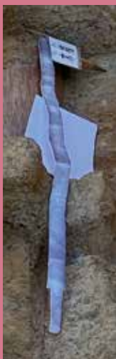
富雄丸山古墳 造出し・剣と盾鏡