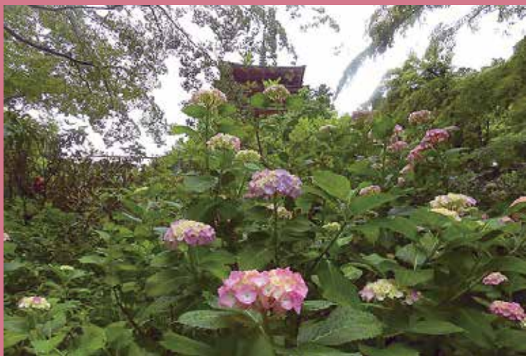
咲き誇るアジサイ

こもりくの初瀬に建つ長谷寺を訪ねます。春は桜に牡丹、夏はアジサイ、秋は紅葉と花の御寺で名高い長谷寺は真言宗豊山派の総本山、西国三十三か所第8番札所です。本堂の西の岡(本長谷寺)に、道明上人が天武天皇の病氣平癒を願って「銅板法華説相図」を安置したのが始まり。仁王門をくぐると399段の風雅な登廊、上がった本堂には靈験あらたかな十一面観音が祀られています。像高10.1mの巨大な像は日本最大の木造です。