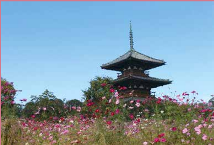
青空とコスモスと国宝法起寺三重塔

聖徳太子建立の「法隆寺」、現存最古の三重塔「法起寺」、太子の病気平癒を願い建立された「法輪寺」の三塔を巡ります。JR法隆寺駅から太子ゆかりの成福寺(伝葦垣宮)跡、上宮遺跡公園、中宮寺跡をたどり法起寺、法輪寺で飛鳥様式の三重の塔を仰ぎます。法隆寺五重塔は境内の西円堂から眺望し、100年前に会津八一が詠み、回廊のすぐ横に立てられた歌碑からも望みます。聖徳太子1400年御恩忌を五感で感じる道のりです。