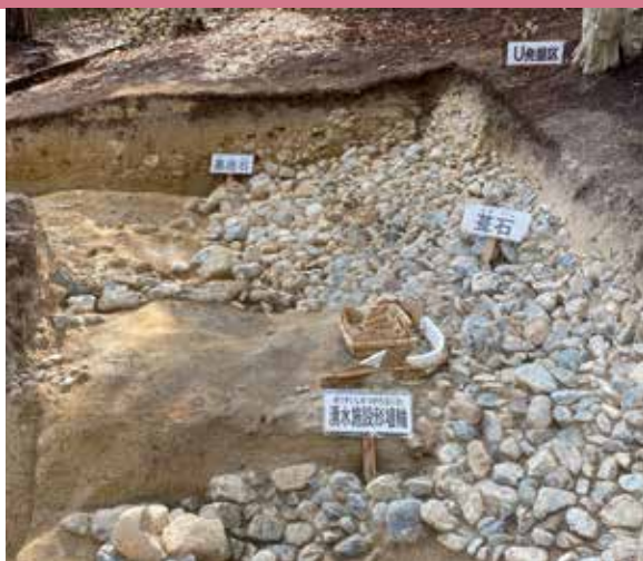
富雄丸山古墳 湧水施設埴輪

古代東アジア最大・最古の蛇行剣、鼉龍文盾形銅鏡が発見されたことで一躍有名になった富雄丸山古墳は、4世紀後半に築造された日本最大の円墳です。円筒埴輪、鰭付き円筒埴輪の並べ方、祭祀遺構から見つかった湧水施設形埴輪など、富雄丸山古墳からはたくさんのオンリーワンが見つかっています。